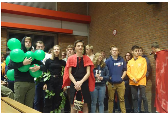
De schachten, seconden voor het toneeltje begon

Week 3 bracht traditiegetrouw de Schachtenverkoop met zich mee. De schachten lieten zich van hun beste kant zien in het zelfgeschreven toneeltje van de schachtenmeester. Maar liefst 283 bakken gingen de deur uit voor de felbegeerde schachtjes. Achteraf konden de kopers samen met hun aanwinst(en) helemaal los gaan op de Bar Bar West.