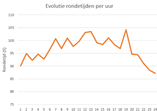
De 24 urenloop in cijfers

In week 5 werd het tijd om de beentjes nog eens te strekken en de stembanden te smeren: het was namelijk weer 24 urenloop! We wisten maar liefst X rondjes te lopen en zo twee rondjes boven Atmosphere te eindigen, op onze welverdiende zevende plaats. Gemiddeld werd er aan onze loopstand 1'36" gedaan over een rondje, toch wel een prestatie. Maar niet enkel de loopstand was