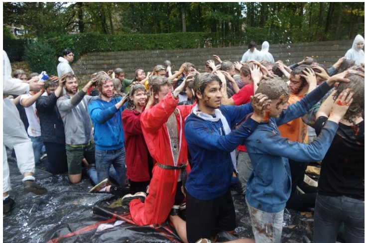
De schachten wasten elkaars haar grondig

Na een week vol plezier met hun kopers, werden de schachten in week 4 gedoopt. Moedig doorstonden ze schachtenpap en stinkende kleren tijdens het vuile deel, om na een korte douche en maaltijd enkele uitdagingen aan te gaan op de Oude Markt. Als afsluiter werden ze plechtig gedoopt, waarna ze trots met hun pasverworven lintje op de Barlez-vous Français konden gaan prijken.