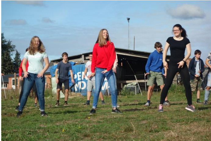
De eerstejaars oefenden hun dansje op EJWiekent

Geloof het of niet: we zitten deze week al op de helft van het semester! Om toch nog even te kunnen nagenieten van de afgelopen weken, geeft Communicatie hieronder een selectie van de beste momenten.