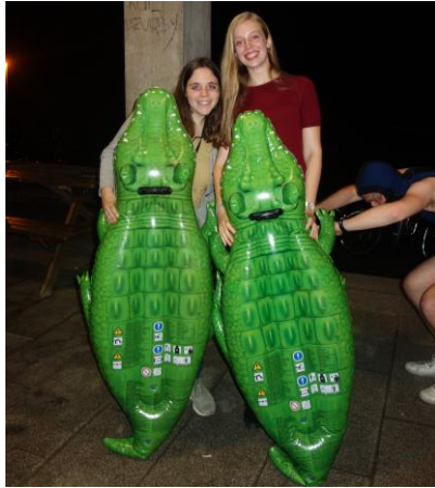
Weet je wat ik wil? Een opblaaskrokodil!

Op woensdag van diezelfde week kon iedereen zich na lang wachten terug onderdompelen in de sferen van de Winabar: Barquarium. De eerste bar was meteen een knaller van formaat: er was ongelooflijk veel volk en na amper 55 minuten was het eerste vat al leeg. Tegen middernacht wisten de feestvierders al een tweede vat leeg te krijgen, waarna er genoten kon worden van een gratis vat. De sfeer zat goed, er was leuke muziek en als hoogtepunt: opblaaskrokodillen, -bananen en -eenhoorns! Wat wil je nog meer?