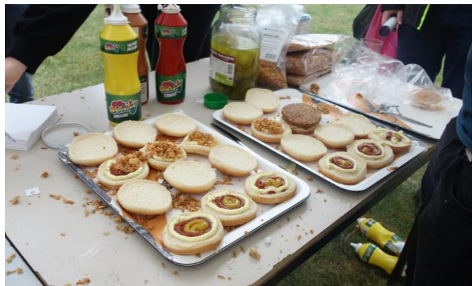
Wij watertanden nog steeds over de bicky's op de inschrijfstand

In die eerste week vond natuurlijk ook de inschrijfstand plaats. Heel wat leden begaven zich naar de campus om niet alleen een lidkaart, maar ook een heerlijke bicky te bemachtigen. Wina telt momenteel maar liefst 453 gewone leden en 21 ereleden! Ook een aantal mensen van het academisch personeel wist zich aan te sluiten: 21 van hen zijn reeds in het bezit van een TAP-kaart (TAP staat voor Tof Academisch Personeel), maar het gerucht doet de ronde dat er nog meer geïnteresseerden zijn.