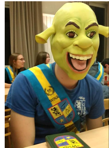
De enige echt Shrek als special guest op de Get Out Of My Swamptus

In week 2 was er de allereerste Wina-cantus van het jaar: de Get Out Of My Swamptus. Volledig in het thema van Shrek waren er leuke memes en zelfs een levensechte Ogre (zie foto) te vinden in de zaal. Gelukkig wisten alle cantusgangers heelhuids uit de seniors Swamp te ontsnappen.