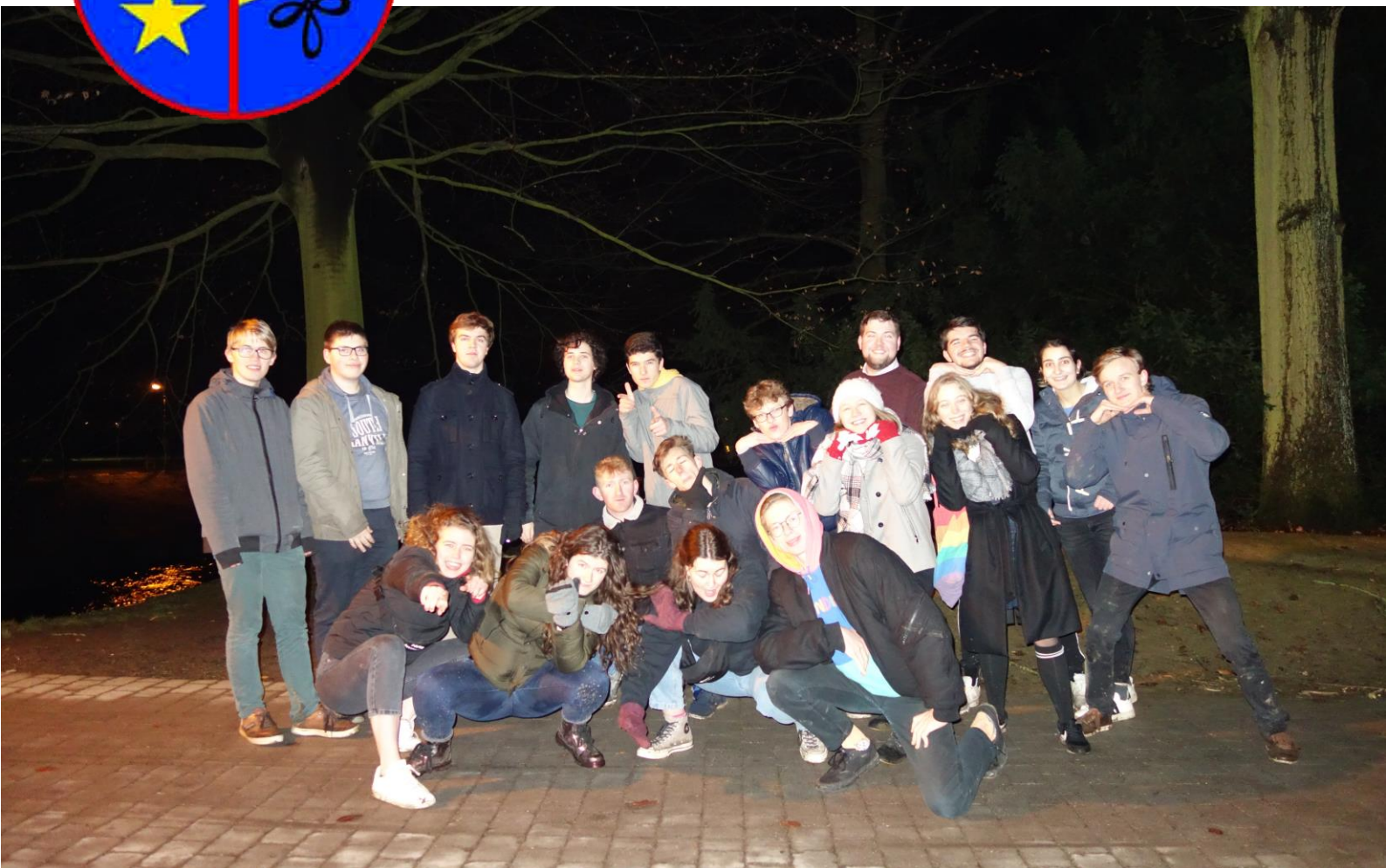
De eerstejaars gingen de strijd met elkaar aan tijdens EJW Lasershoot.

Wekelijks blaadje van studentenkring Wina verspreid onder studenten wiskunde, fysica en informatica.