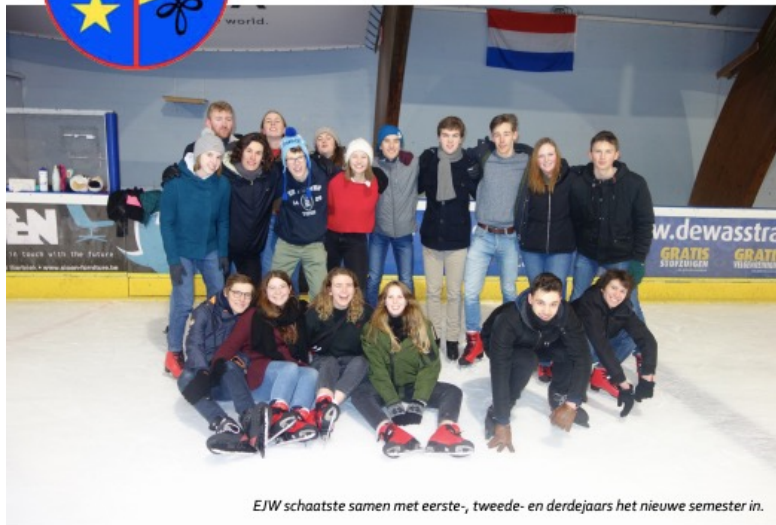
EJW schaatste samen met eerste-, tweede- en derdejaars het nieuwe semester in.

Wekelijks blaadje van studentenkring Wina verspreid onder studenten wiskunde, fysica en informatica.